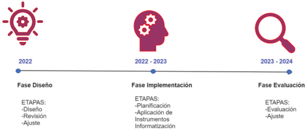
Etapas de Desarrollo y Fases de Instalación de SIRME

Cada una de las fases de instalación antes mencionadas consideran procesos formativos permanentes a través de talleres y encuentros de modelamiento con la comunidad para asegurar la comprensión del Sistema y su función, resguardando su adecuada utilización y el cumplimiento del objetivo de SIRME.