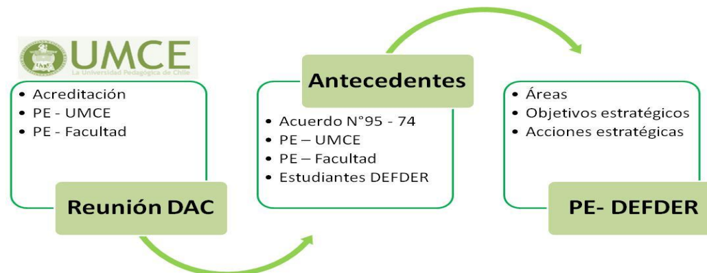
Ilustración 1 – Diagrama Proceso – Plan Estratégico DEFDER 2016-2020

Ante estos antecedentes es que desde el año 2013, se comienza a trabajar en un Plan de Desarrollo, a partir del cual se elabora el presente documento y que recoge también las demandas visualizadas externamente al departamento (procesos de acreditaciones, análisis institucionales de la carrera, participación de egresados y empleadores), como a su vez internas (encuestas de evaluación docente, reuniones con el Centro de Estudiantes de Educación Física (CEEF) y consejo académico del departamento), por lo cual se desarrolló el siguiente procedimiento: