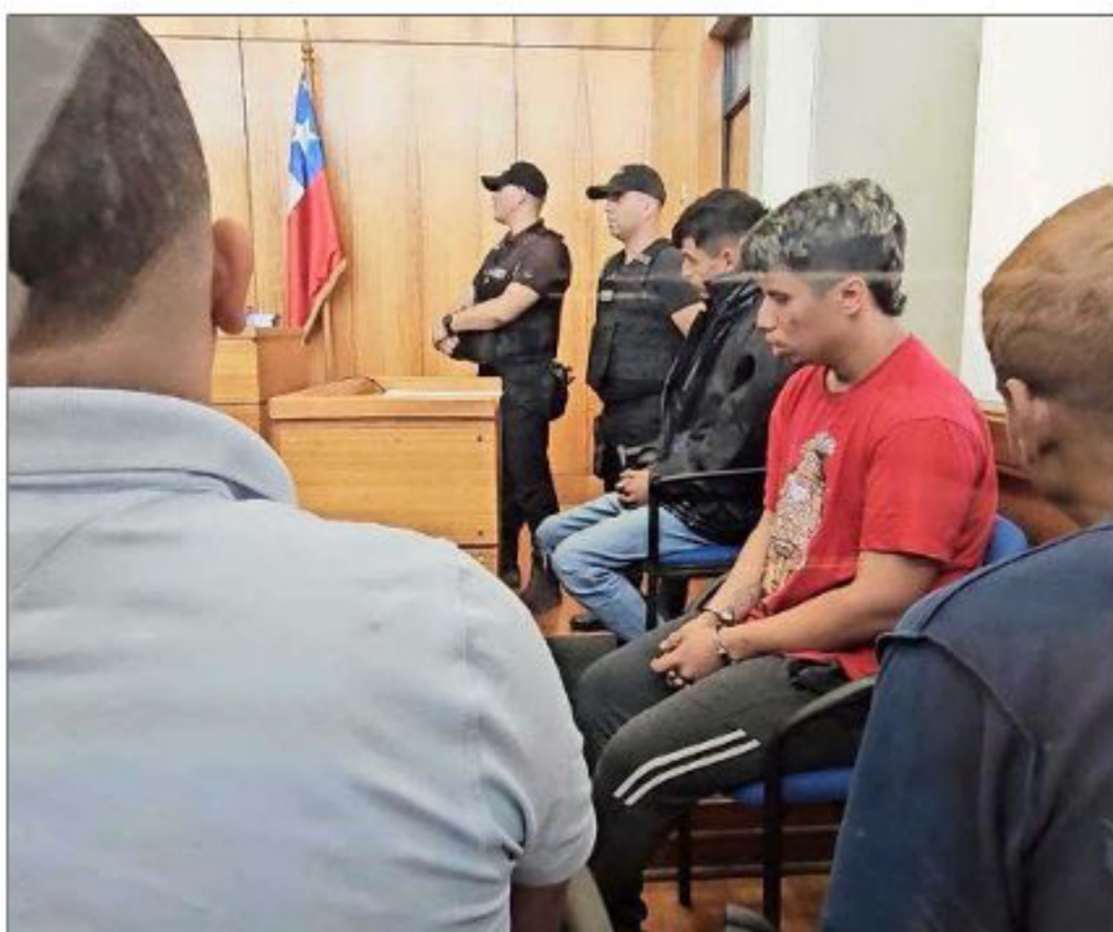
AMPLIACIÓN DE LA DETENCIÓN.— La fiscalía espera reunir un mayor número de evidencias para presentar cargos en contra de los extranjeros.

En tanto, como un hecho "violento y muy cobarde" ca-