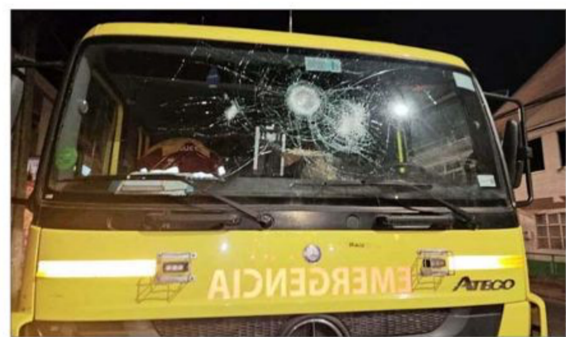
AGRESIÓN.— El conductor del minibús que trasladaba a los trabajadores sufrió lesiones. En la imagen se observa el impacto en el parabrisas.

Sobre los ataques y robos que afectan a los transportistas de carga en las rutas del país, la secretaria de Estado recordó que "con los camioneros hay un espacio de trabajo que lleva el subsecretario (Manuel) Monsalve, para pensar medidas de refuerzo".