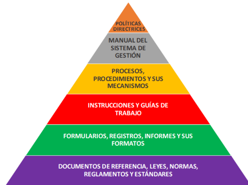
Imagen 2: estructura de la documentación

El sistema organiza la documentación como se muestra en Imagen 2: estructura de la documentación.