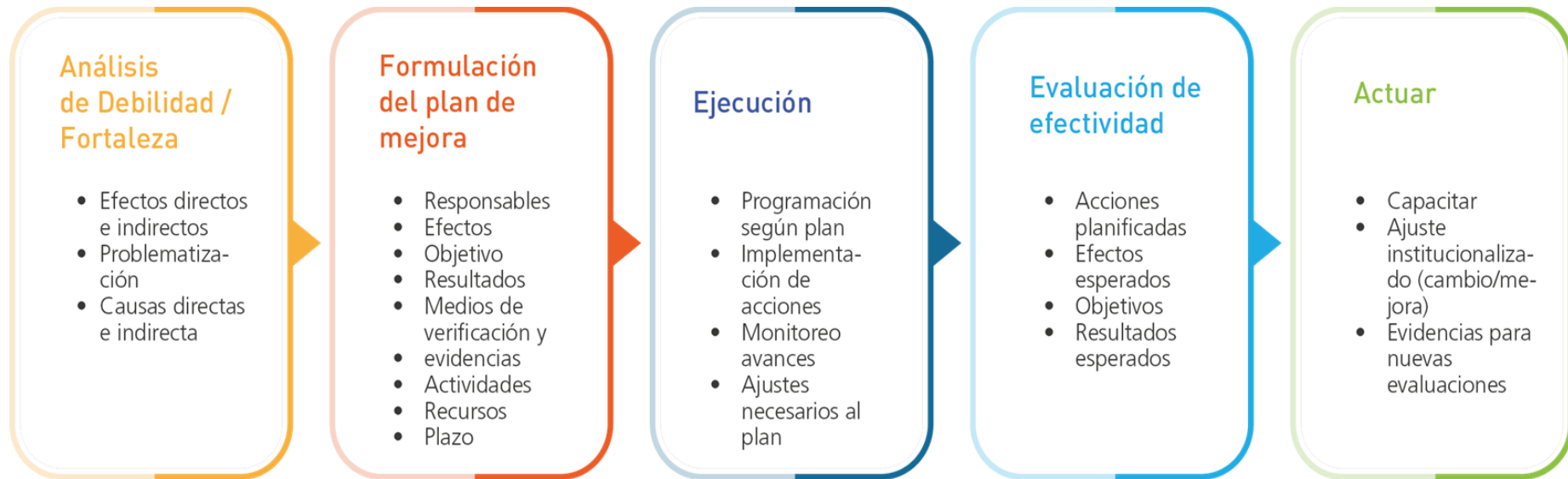
Imagen 3: Planificación, ejecución, evaluación e implementación de planes de mejora